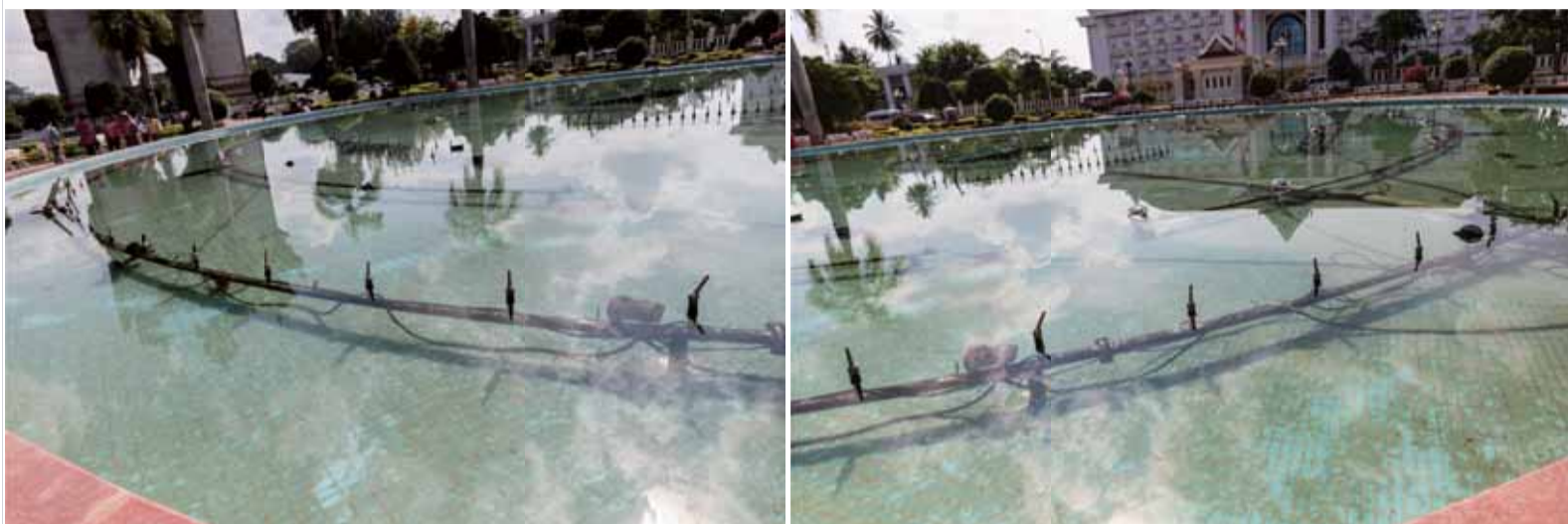
580mm x 820mm(each) ラムダプリント