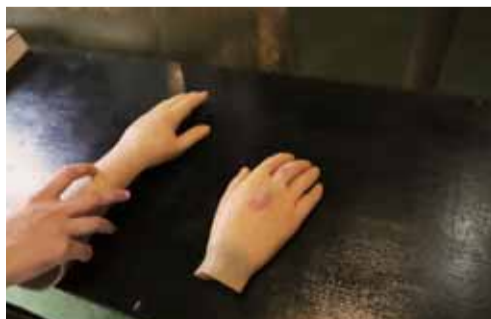
370mm x 247mm ラムダプリント