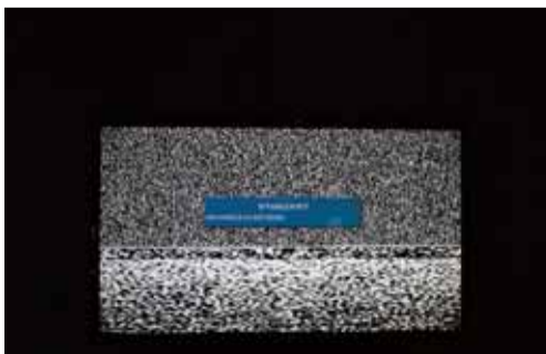
420mm x 320mm ラムダプリント